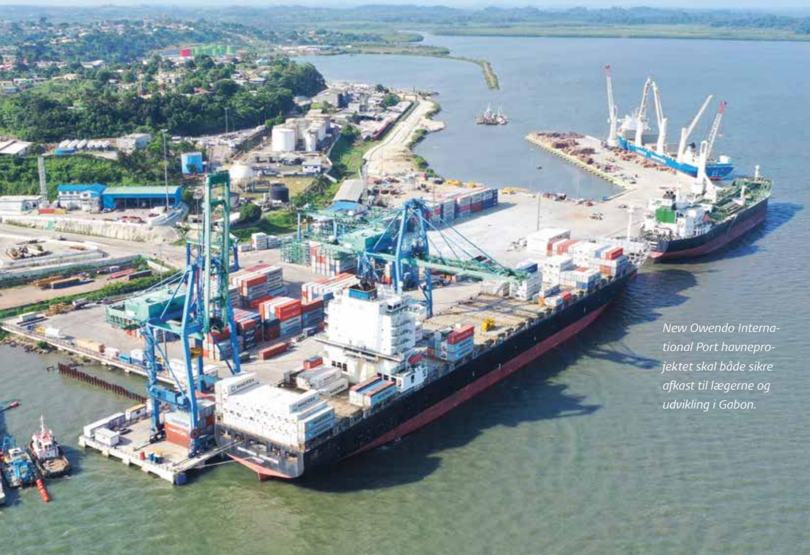
New Owendo International Port havneprojektet skal både sikre afkast til lægerne og udvikling i Gabon.