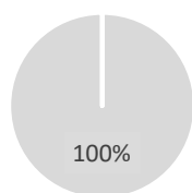
1. Investeringer i overensstemmelse med klassificeringssystemet, inkl. statsobligationer*

■ I overensstemmelse ■ Andre investeringer